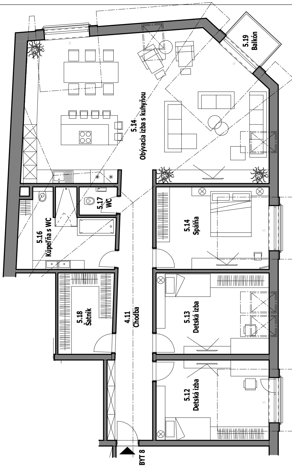
Pôdorys 5. NP - podkrovie - BYT 8